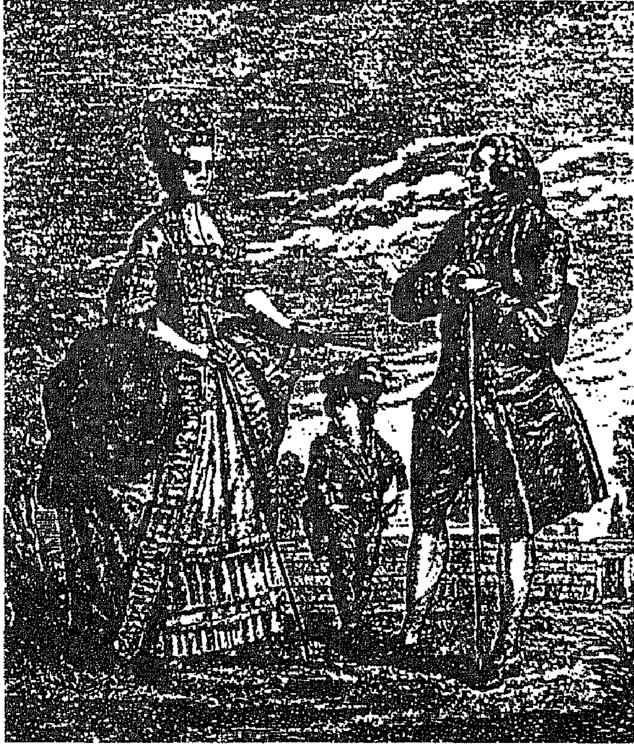
الأسرة البورجوازية الكلاسيكية، القرن الثامن عشر في فرنسا.